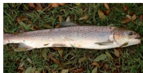
Waterkrachtcentrales belemmeren ook de stroomopwaartse vistrek. Deze volwassen zalm is ernstig gewond geraakt bij zijn pogingen om via de turbine voorbij de centrale te komen.