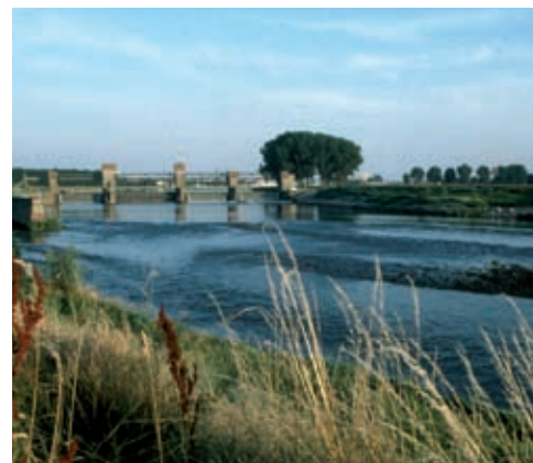
De locatie bij Borgharen is wegens zijn ligging aan de Grensmaas van groot belang voor de vismigratie door deze rivier.