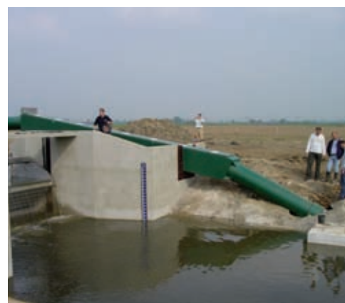
De hevelvispassage van het systeem 'Manshanden' is uitermate geschikt voor de kleinere wateren in ons land.