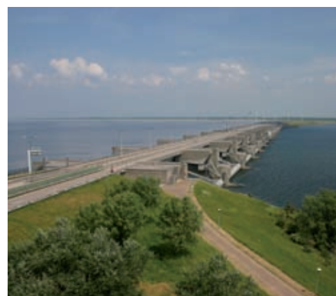
De mogelijke aanleg van waterkrachtcentrales in de Haringvlietsluizen vormt een ernstige bedreiging voor de vismigratie door deze zoet/zout overgang.